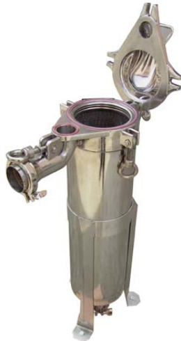
дзеркальне полірування виконання