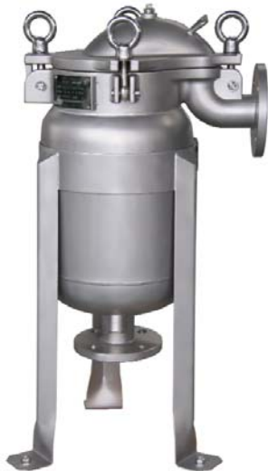
корпус з нагрівальною сорочкою